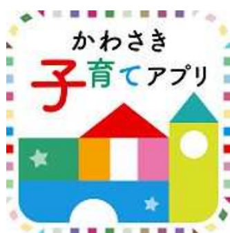
かわさき子育てアプリ