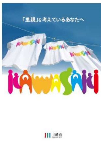
川崎市里親制度パンフレット