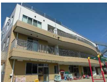
川崎区保育・子育て総合支援センター (令和元年9月開所)

また、保育所機能の強化として、保育・子育て総合支援センターにおいて、一時預かり事業等を実施しています。