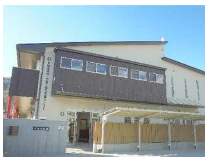
中原区保育・子育て総合支援センター (令和3年3月開所)