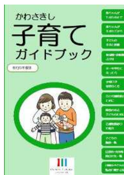
子育てガイドブック