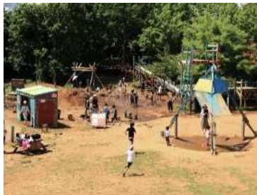
子ども夢パークにおける泥んこ遊び