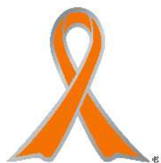
オレンジリボンマーク