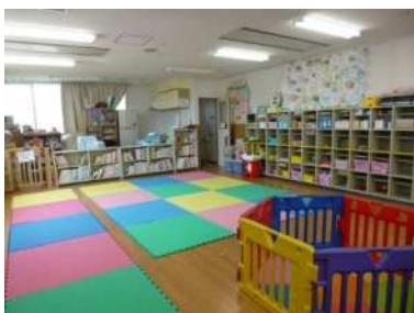
幸こども文化センター乳幼児室

多様な体験や活動を通じた児童の健全育成を推進するとともに、市民活動の地域拠点として、59か所のこども文化センター等の運営及び維持・補修を行います。