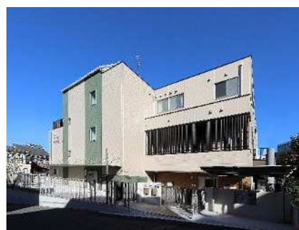
宮前区保育・子育て総合支援センター (令和5年10月開所)