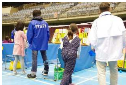
青少年フェスティバル