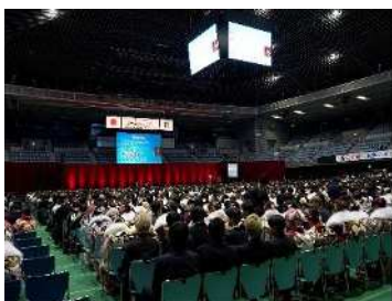
二十歳を祝うつどい