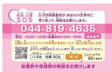
妊娠・出産SOSカード