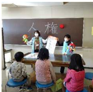
11月20日は子どもの権利の日 子どもの権利の日のつどいにおける一部企画の様子