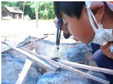
黒川青少年野外活動センターでの 野外体験活動の様子